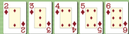
Straight Flush Straight mit fünf Karten derselben Symbole