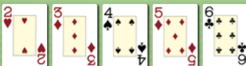
Straße (Straight) Fünf aufeinanderfolgende Kartenwerte, beliebige Symbole