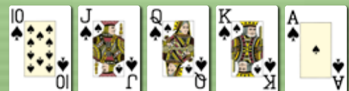
Royal Flush Straight Flush mit den Werten 10, Bube, Dame, König, Ass bei gleichen Symbolen