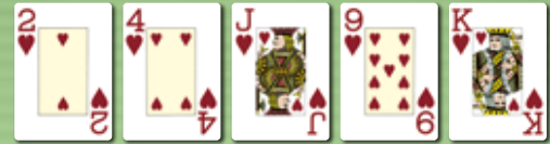
Flush Fünf Karten derselben Symbole, die nicht aufeinanderfolgen