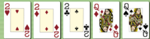
Full House Drei Gleiche und ein Paar