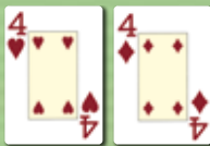
Ein Paar (one pair)