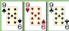
Drilling (three of a kind)