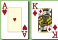
Die höchste Karte (high card)

Die Rangfolge der Kartenkombinationen ist in aufsteigender Wertigkeit wie folgt: