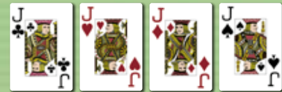
Vierling (Poker, four of a kind)